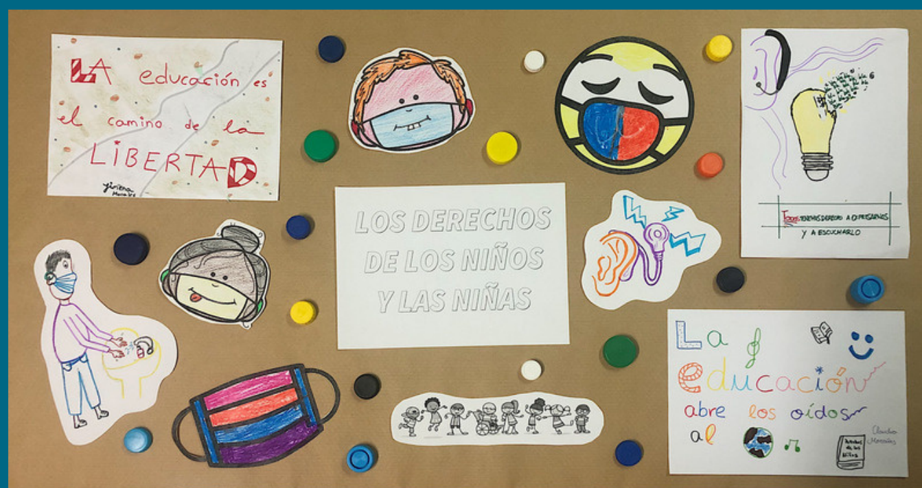
SAN FCO. SALES - HUESCA

A través de la creatividad proyectada en los murales, los más pequeños y jóvenes socios del Movimiento Asociativo FIAPAS han reflejado sus vivencias y experiencia educativa durante la situación de confinamiento y de alerta sociosanitaria, motivada por la pandemia Covid-19.