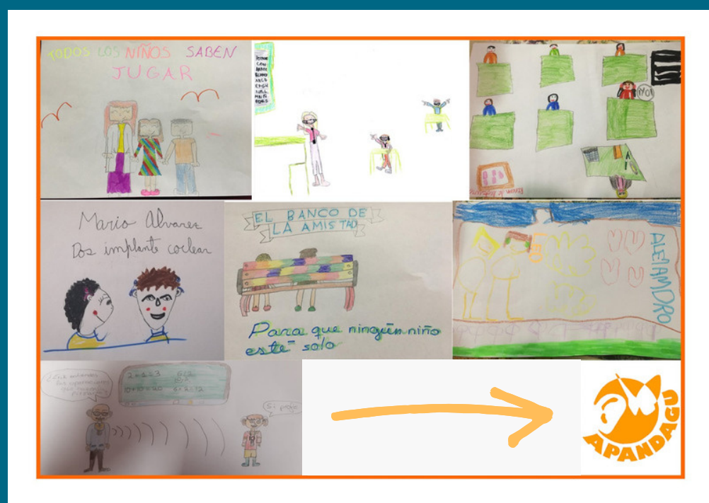
APANDAGU - GUADALAJARA