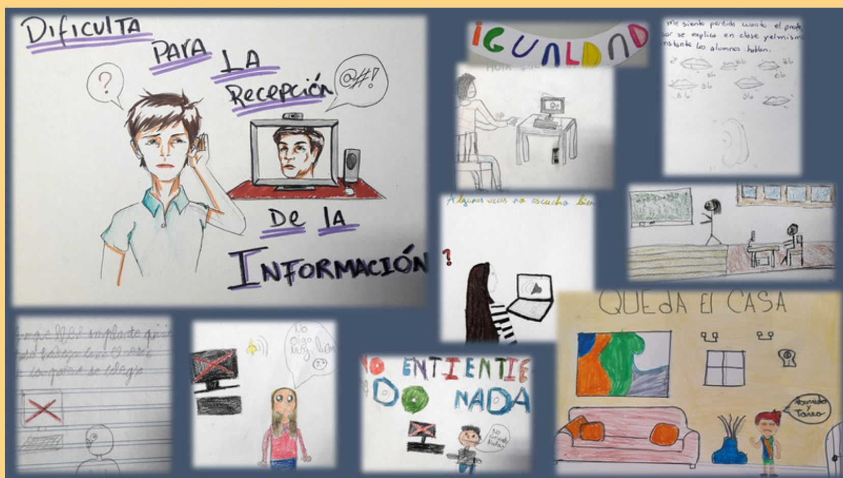
ASPASOR - ÁLAVA